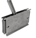
Sabitleyici Montaj araçları